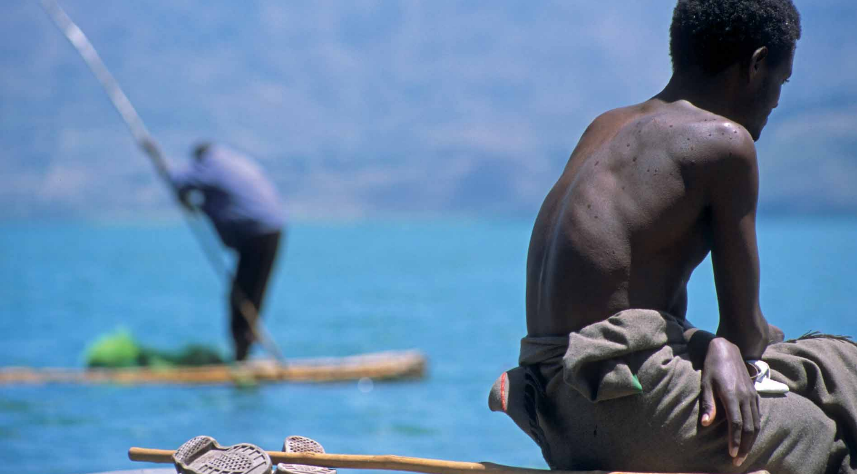
Rybaczy nad jeziorem Haik – Etiopia.