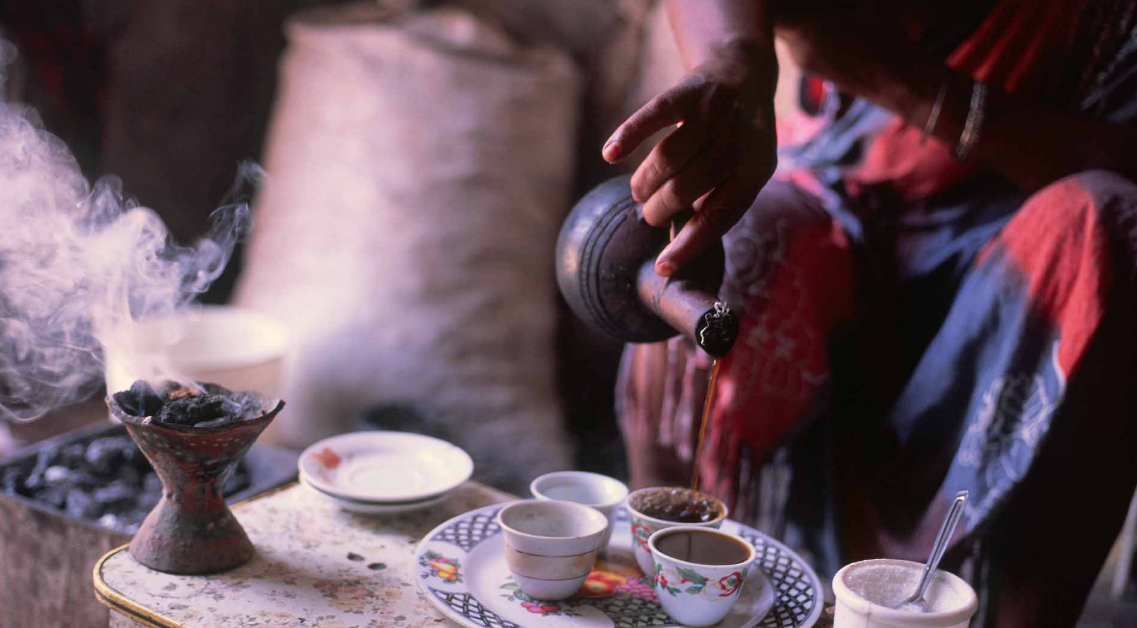
Tradycyjna ceremonia parzenia kawy, port Massawa – Erytrea.