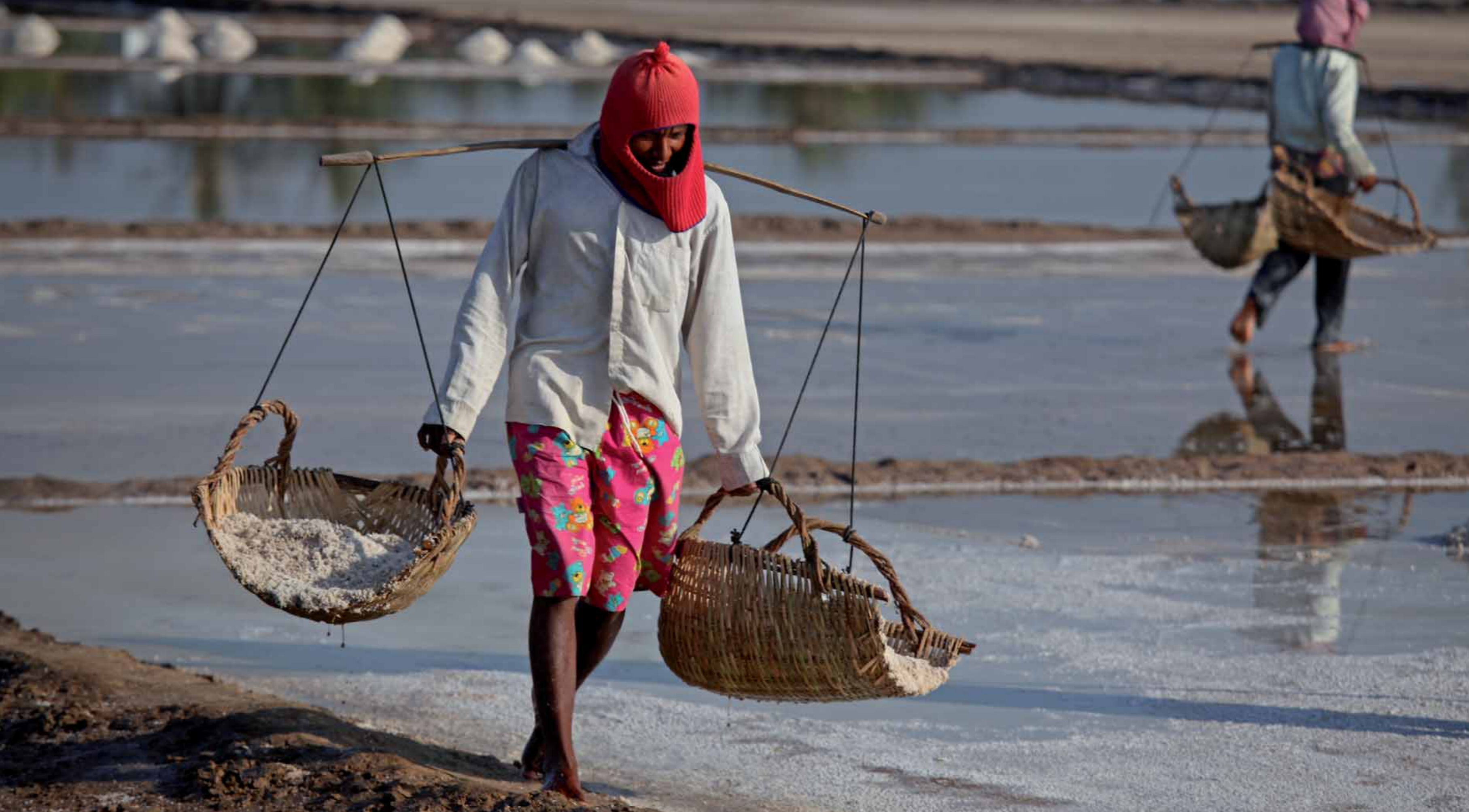
Pozyskiwanie soli morskiej – Kambodża.