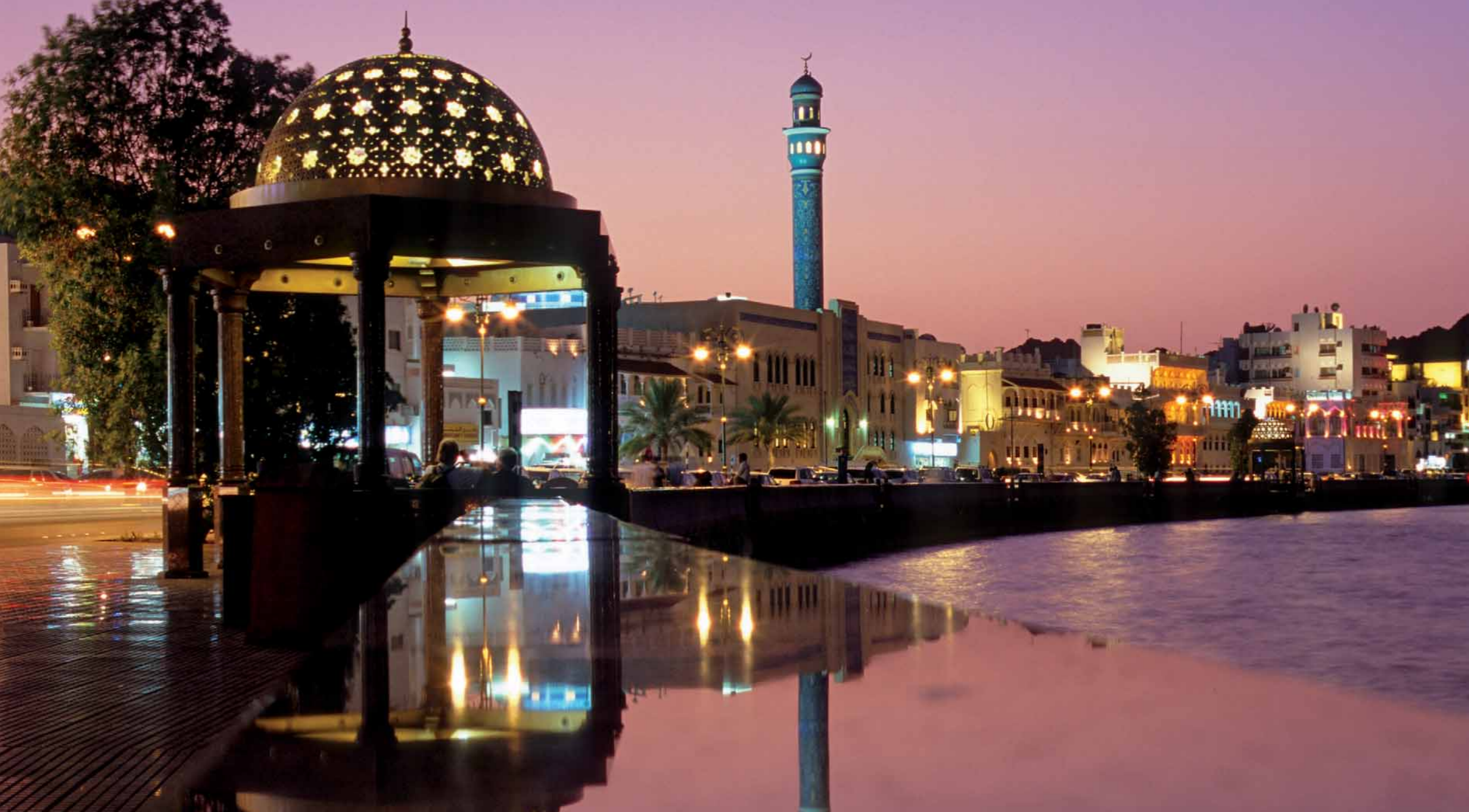
Zachód słońca w Muscatie – Oman.