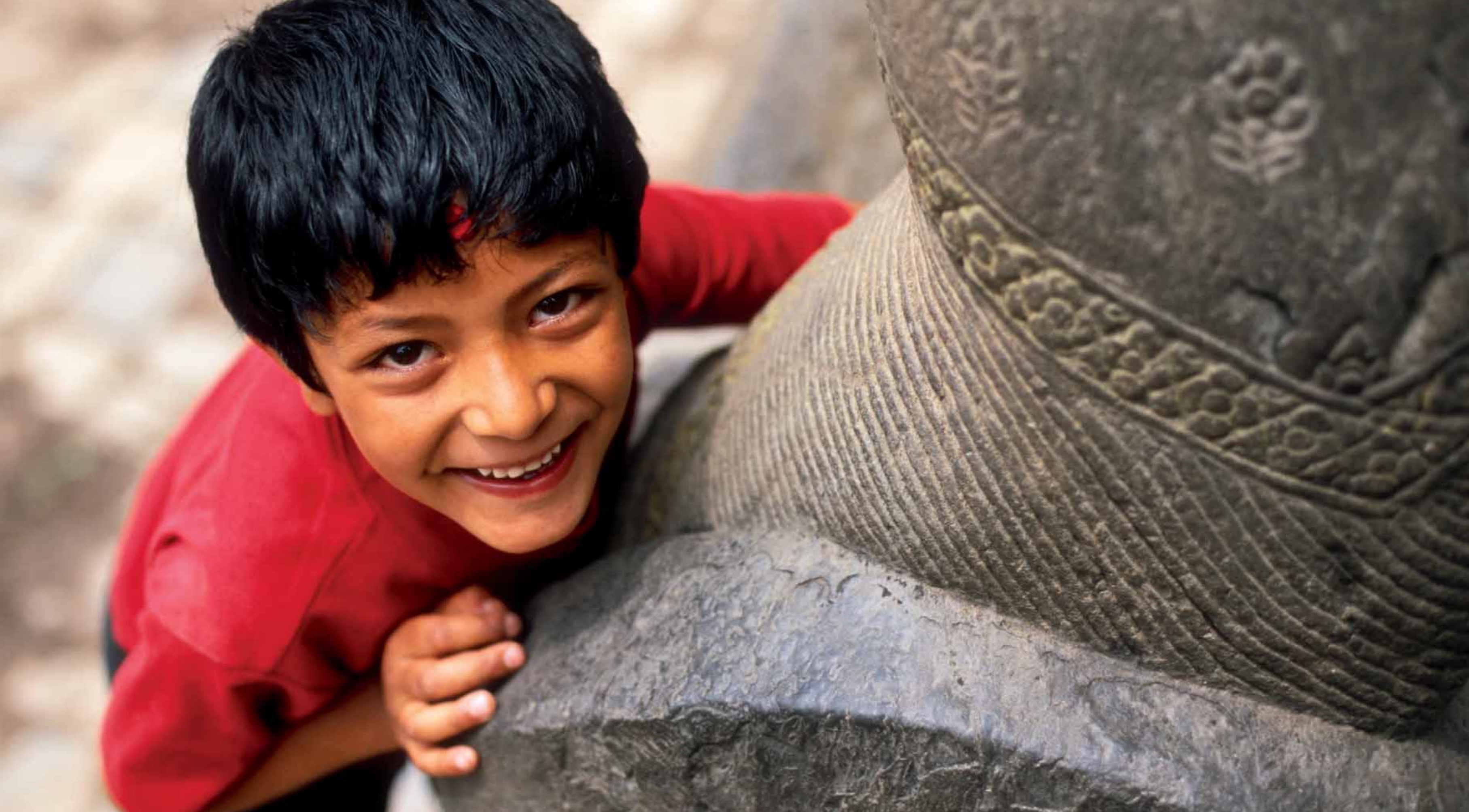
Chłopiec – Bhaktapur, Nepal.