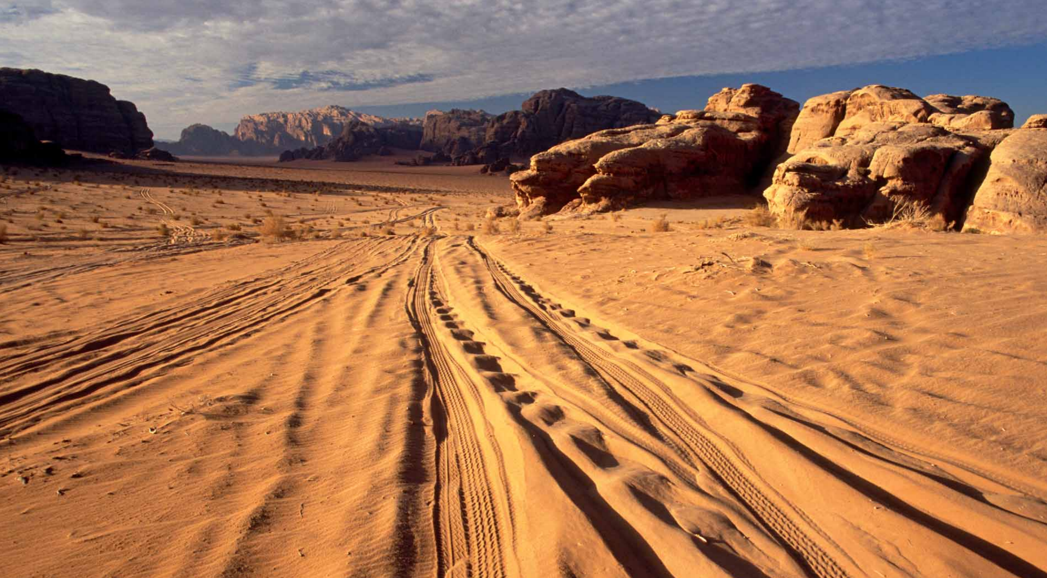
Pustynia Wadi Rum – Jordania.

2 0 1 1 L i s t o p a d / N o v e m b e r