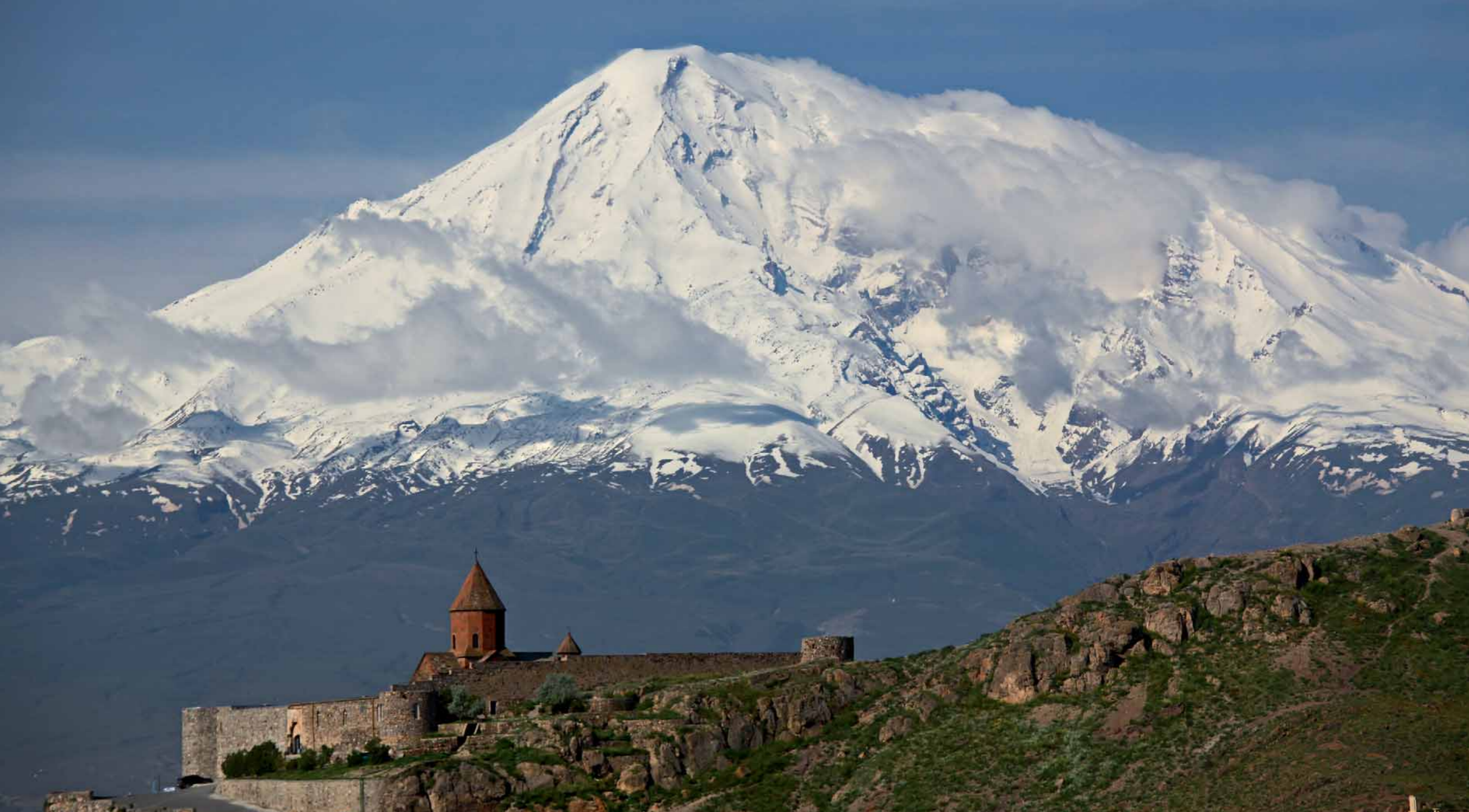
Ormiański monastyr Khor Virap. W tle położona już po tureckiej stronie święta góra Ormian – wulkan Ararat.