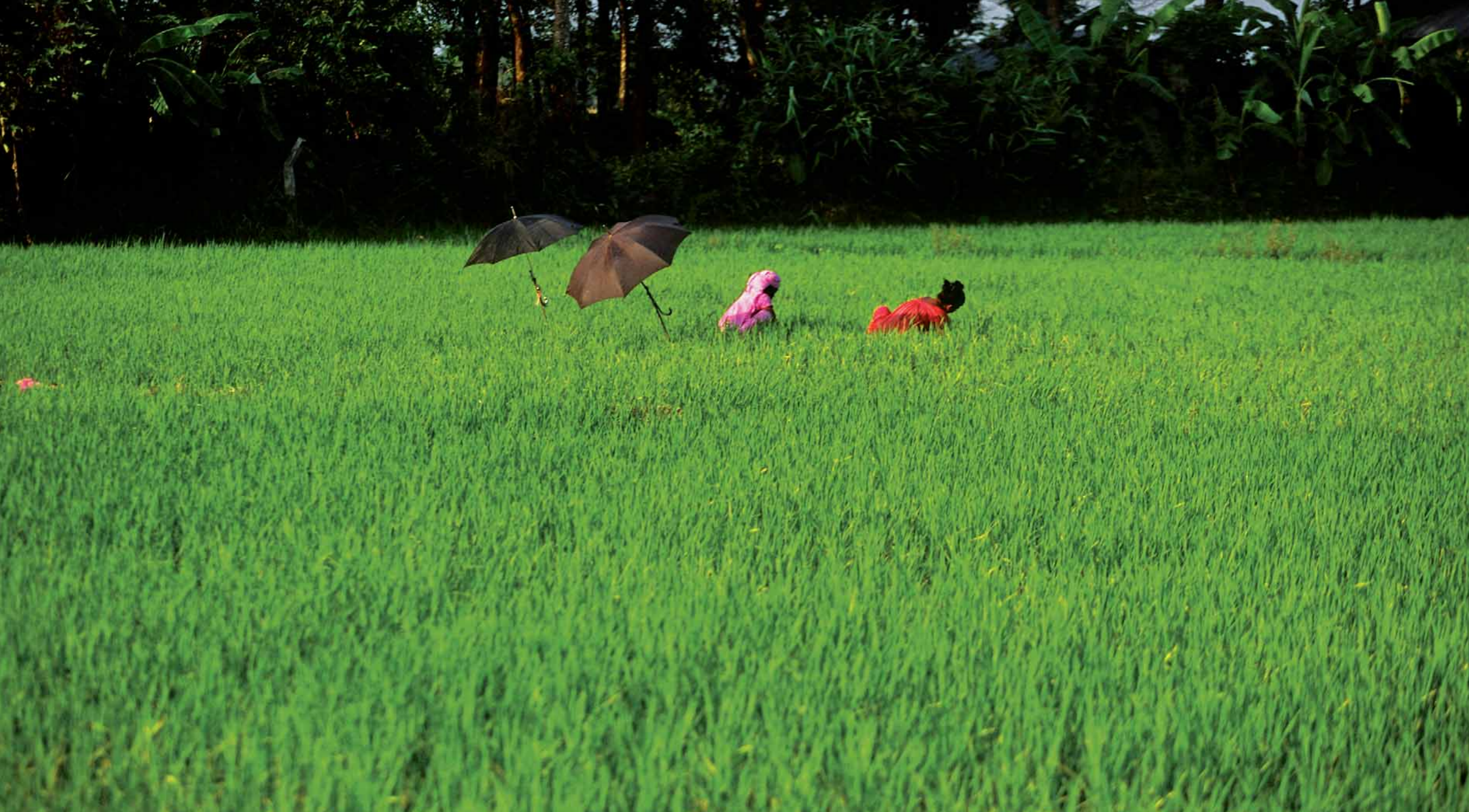
Pola ryżowe – Nepal.

2 0 1 1 W r z e s i e ń / S e p t e m b e r