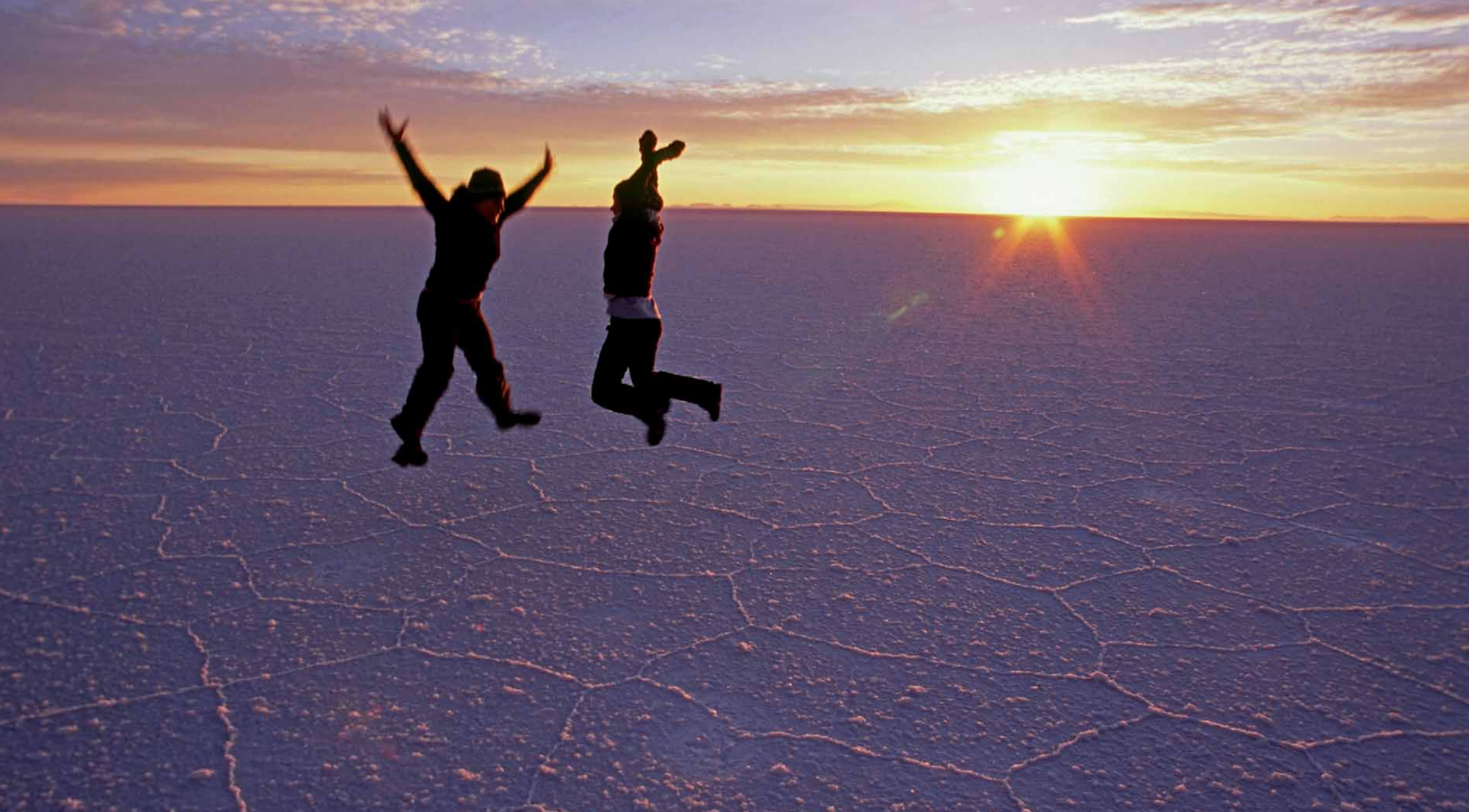
Salar de Uyuni, największe solnisko świata – Boliwia.