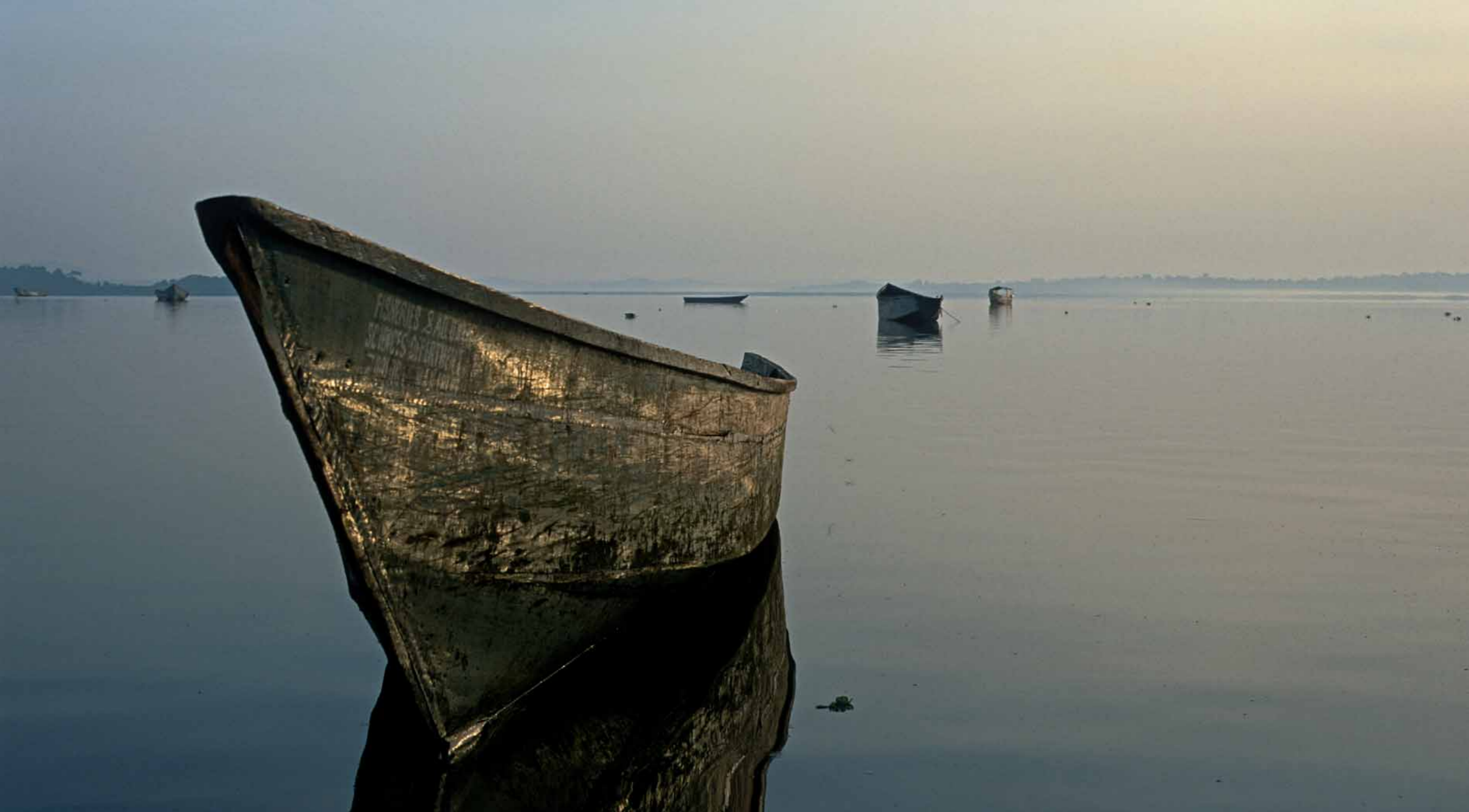
Jezioro Wiktorii – Uganda.