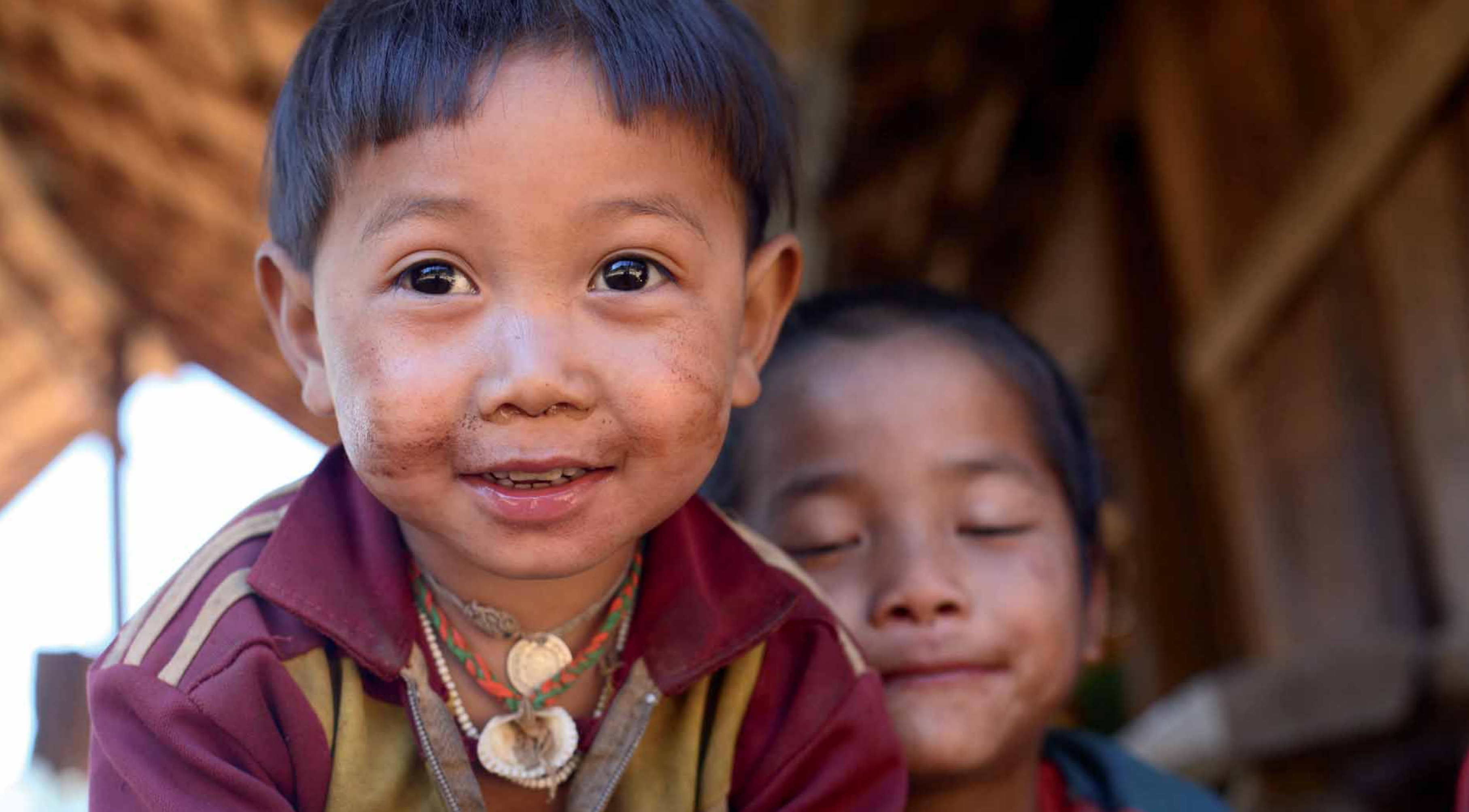
Dzieci z wioski plemion górskich Akha - Laos.

2 0 1 1 G r u d z i e ń / D e c e m b e r