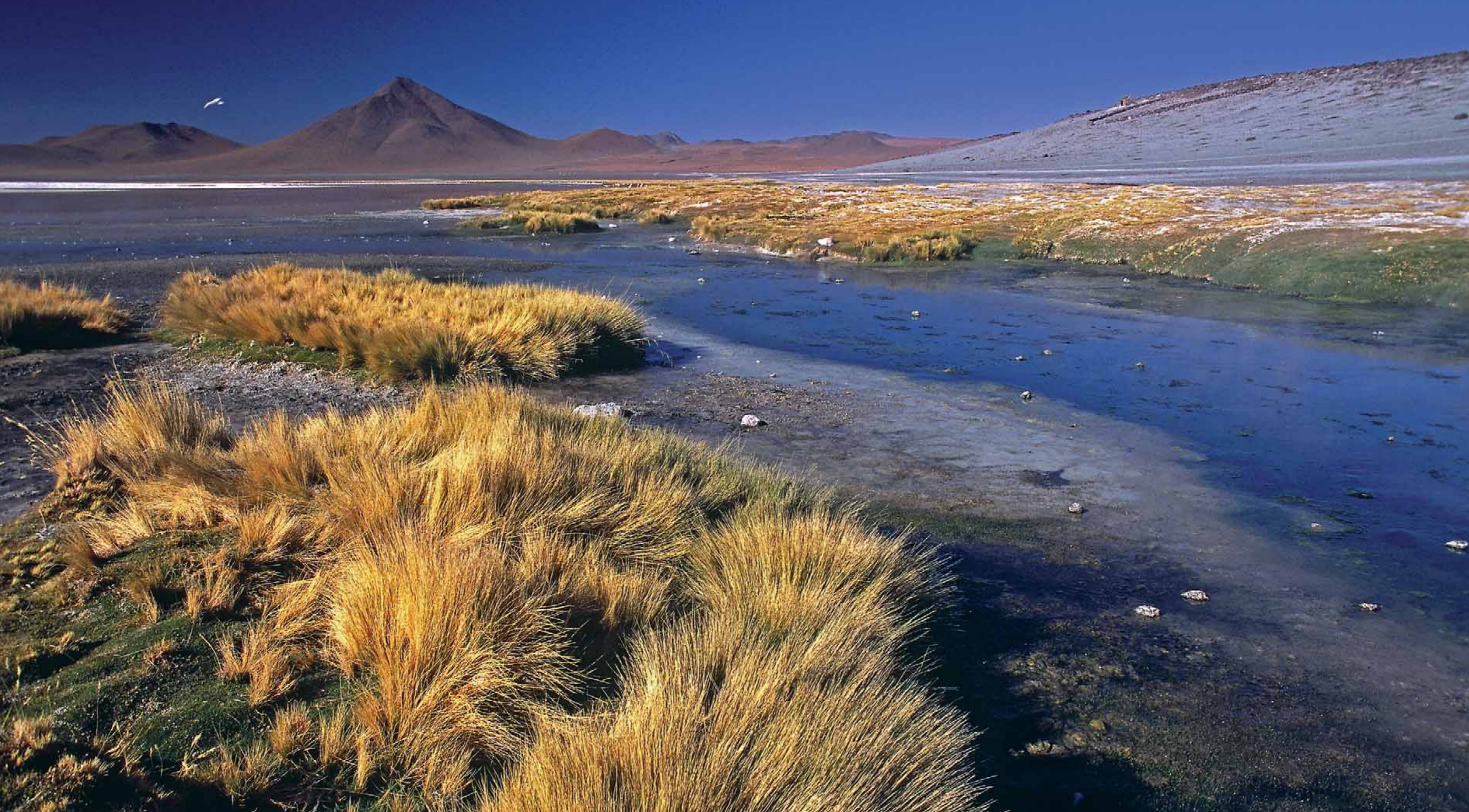
Laguna Colorado, płaskowyż Altiplano – Boliwia.