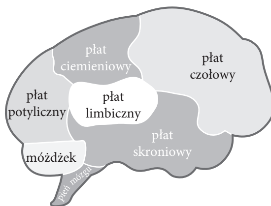
Uproszczona budowa ludzkiego mózgu

Przed rozpoczęciem podróży musisz uświadomić sobie, jak zbudowany jest ludzki mózg i w jaki sposób funkcjonuje. Struktura centralnej części ośrodkowego układu nerwowego jest bardzo skomplikowana, tutaj zatem przedstawimy ją w sposób uproszczony – wyróżniając siedem współpracujących ze sobą elementów.